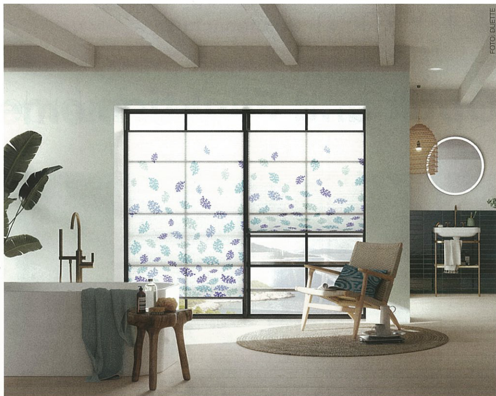
Bei Elements handelt es sich um eine Design-Kollektion für Rollos, Plissees und Duette Wabenplissees, deren verbindende Klammer die vier Elemente Feuer, Wasser (im Bild), Erde und Luft sind.

Sie setzen Schwerpunkte Ihrer Arbeit bei Funktionalität, Innovationskraft und Nachhaltigkeit, Ästhetik und Langlebigkeit. Lässt sich das immer mit den Wünschen und den Vorstellungen von Kunden in Einklang bringen?