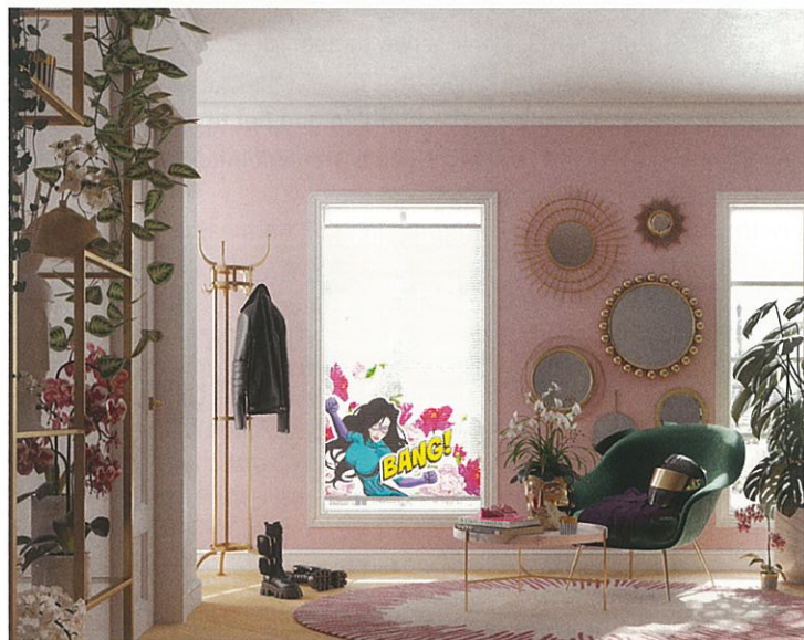
MHZ Duette Wabenplissees mit dem Dessin Marvellous Monkey (oben) und dem Dessin Glamour Girl (unten) aus der Themenwelt „Heroes by sieger“.

Mit insgesamt acht aufsehenerregenden Dessins, entworfen von der mehrfach ausgezeichneten Agentur sieger design, startet der Sicht-, Sonnen- und Insektenschutzhersteller MHZ in das Frühjahr. Farbenfroh und voll positiver Energie machen sie den Wabenplissee-Sonnenschutz zum Blickfang im Raum. Dabei könnten die beiden Themenwelten „Elements“ und „Heroes“ unterschiedlicher kaum sein. Vier Elemente, vier Motive – „Elements by sieger design“ ist wie ein leidenschaftliches „Ja“ zum Leben: Bunte Dreiecke wirbeln wie Flugsamen durch die Luft, abstrahierte Korallen steigen im Wasser empor, schwarze Vögel schweben anmutig am Himmel, ein farbenprächtiges Sternenfeuerwerk entzündet sich. Designer Michael Sieger spielt mit den Elementen und inszeniert sie auf einzigartig kraftvolle Weise.