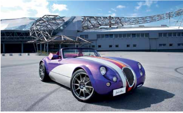
Die markentypische Handschrift der Siegers entdeckte man auch beim Dekor-Konzept für die Wiesmann Roadster MF3 final edition by SIEGER, das 2011 für den Premium-Sportwagenhersteller entwickelt wurde.

Gerade im Industriedesign ließ die Technik keine Quantensprünge mehr zu – Gestaltung wurde somit zu einem entscheidenden Teil der Wertschöpfung.